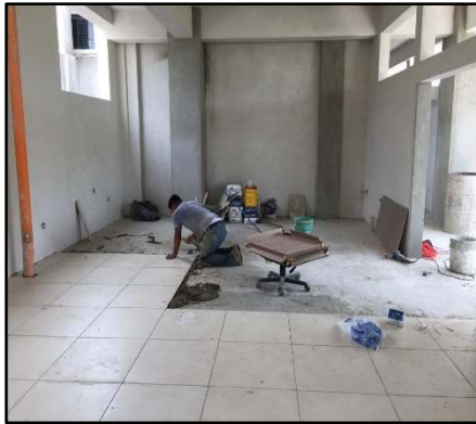
INSTALACIÓN DE PISOS EDIFICIO MUNICIPAL