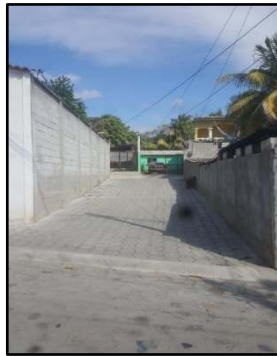
MEJORAMIENTO CALLE BO. LAS ROSITAS