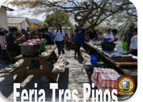
Feria Tres Pinos