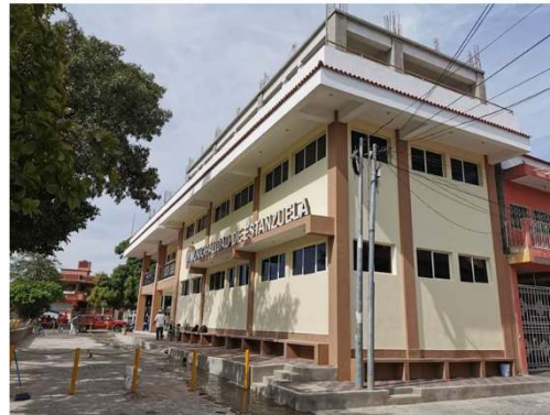
MEJORAMIENTO EDIFICIO MUNICIPAL