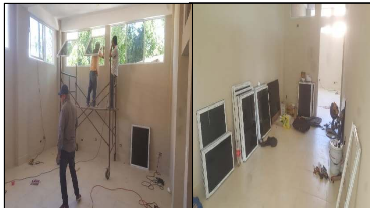
INSTALACION DE VENTANAS EDIFICIO MUNICIPAL