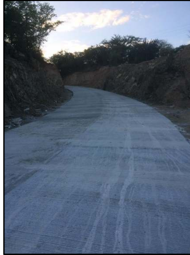
MEJORAMIENTO CALLE QUE CONDUCE DE LA ALDEA CHISPAN HACIA COLONIA SANTA CECILIA, ESTANZUELA ZACAPA

La Dirección de Planificación DMP presenta el informe de planificación y ejecución de obras del año 2019. Proyectos realizados con fondos municipales y fondos ante Consejos de Desarrollo Urbano y Rural.