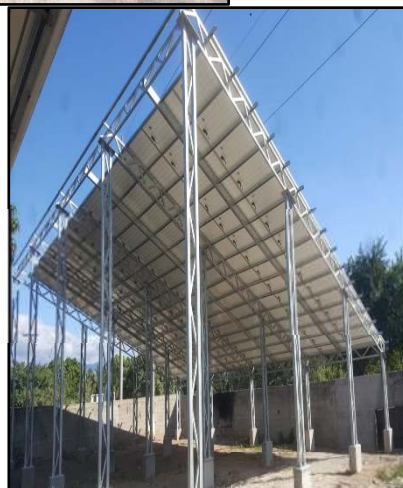
MEJORAMIENTO SISTEMA DE AGUA POTABLE POZO 5 CABECERA MUNICIPAL, ESTANZUELA ZACAPA