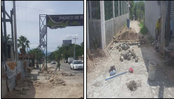
AMPLIACION SISTEMA ALCANTARILLADO SANITARIO PREDIO