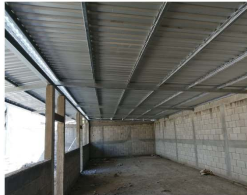
AMPLIACION CENTRO DE CAPACITACION NO.2