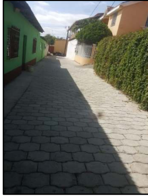
MEJORAMIENTO CALLE BARRIO LAS HAMACAS