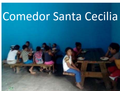
Comedor Santa Cecilia

La Municipalidad de Estandzuela por medio de la Oficina de la Secretaria de Obras Sociales de la Esposa del Alcalde -SOSEA- realiza junto a la Fundación mes a mes la compra de comestible para los Comedores Infantiles de Aldea San Nicolás, Aldea Tres Pinos, Colonia Santa Cecilia y Mis Años Dorados. El Concejo Municipal agradece a la Fundación esta acción y los exhorta a continuar con esa labor altruista.