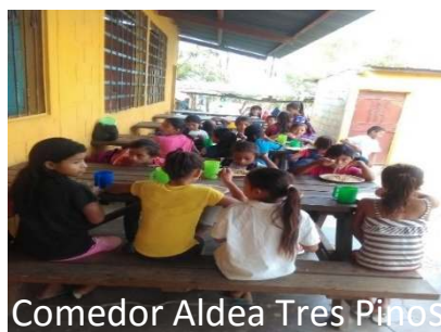
Comedor Aldea Tres Pinos