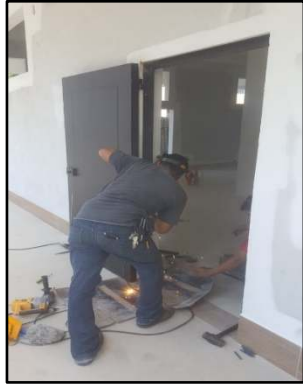
INSTALACION DE PUERTAS EN EL EDIFICIO MUNICIPAL