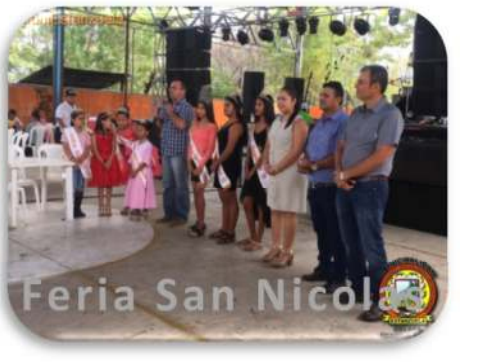
Feria San Nicolás