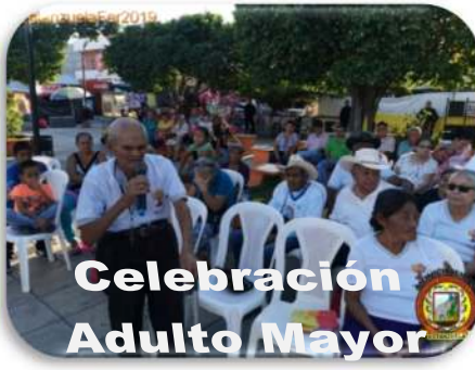
Celebración Adulto Mayor