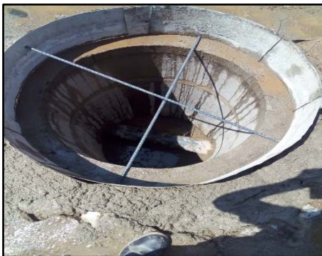
MEJORAMIENTO ALCANTARILLADO ALDEA CHISPAN