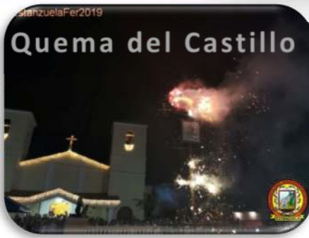
Quema del Castillo