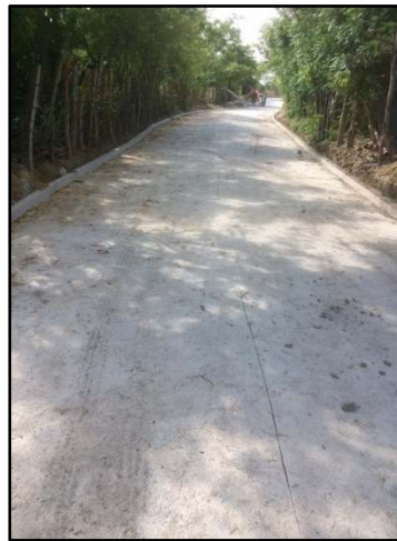
MEJORAMIENTO CALLE ENTRADA PRINCIPAL ALDEA EL GUAYABAL, ESTANZUELA ZACAPA