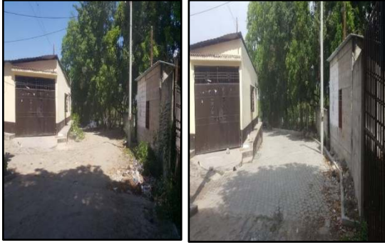
MEJORAMIENTO CALLE COLONIA SAN FRANCISCO